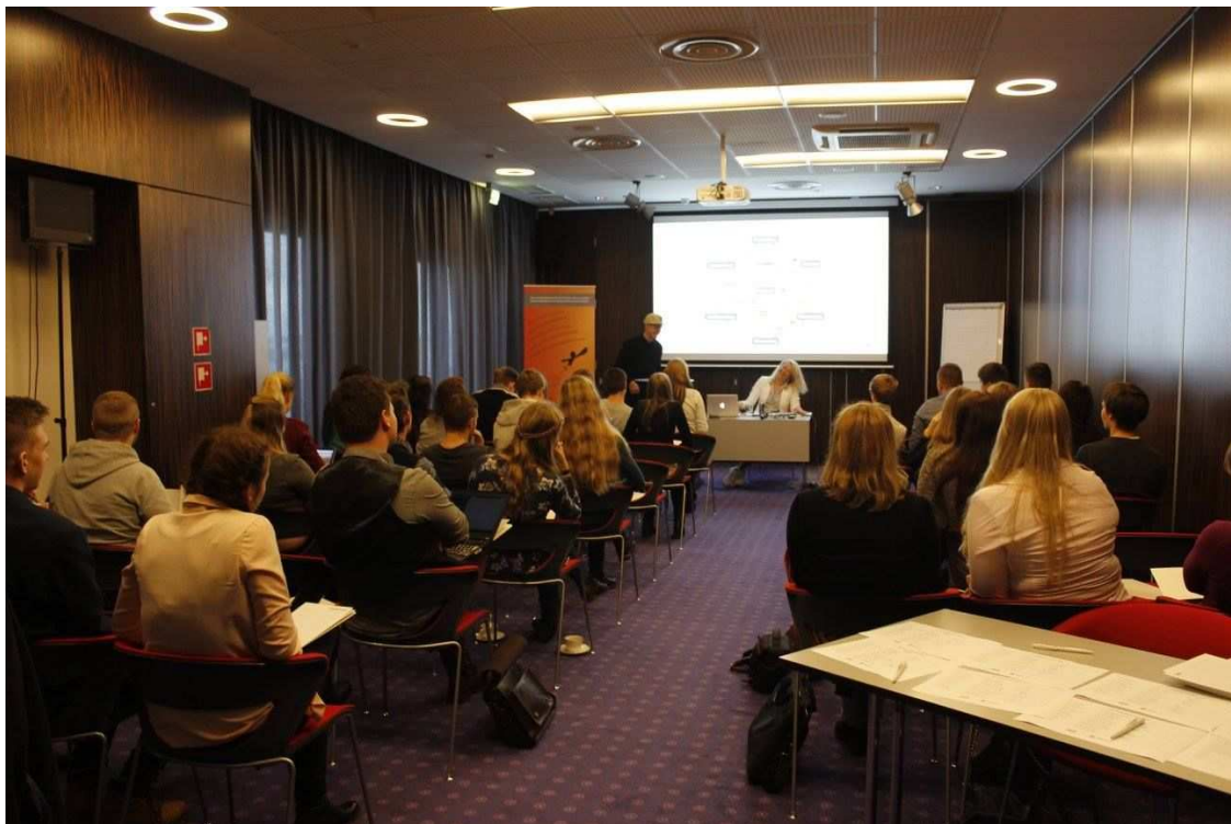
ENL-i meediakonverents 2016.

Esmakordselt peeti ENLi meediakonverentsi kahepäevalisena. Üritus toimus 5. ja 6. novembril Tallinnas. Teemade osas keskenduti sotsiaalmeediale, eetilisele kommunikatsioonile, noorteorganisatsiooni kuvandile ning avalikule esinemisele. Uus kahepäevane formaat sai osalejatelt positiivset tagasisidet ning nõudlus noorte poolt ületas pakutud kohtade arvu.