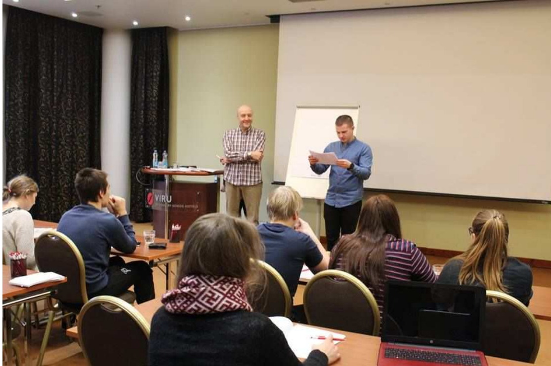
ENLi Talveakadeemia 2016.