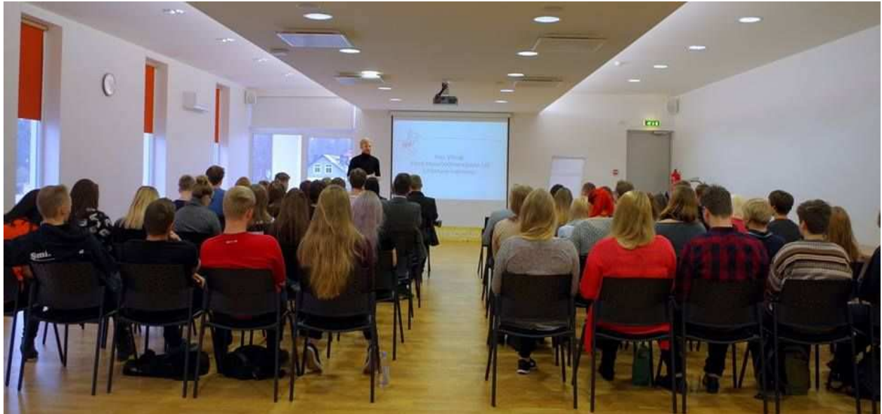
ENLi Sügisseminar 2016 Tartus.

Lisaks toimus erinevaid töötubasid, kus arutati ENLiga seotuid teemasid ning anti sisendit erinevatele projektidele ja ettevõtmistele. Teisel päeval toimus ka üldkoosolek, kus pikendati ühe juhtause liikme mandaati ning kinnitati 2017. aasta tegevuskava ja prognoositav eelarve.