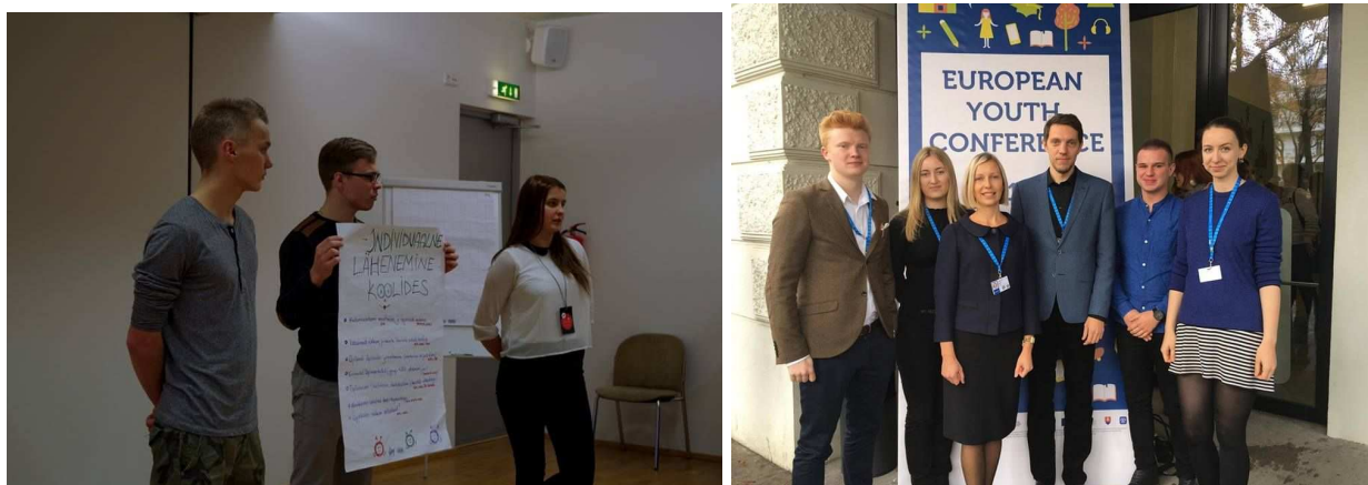
Struktuurse Dialoogi töötuba Sügisseminaril (vasak) ja Euroopa Noortekonverents Košices (parem).

Taaskord viidi Eestis läbi Euroopa Komisjoni projekt Struktuurne Dialoog, mille eesmärgiks on anda noortele võimalus laskuda dialoogi otsuste tegijatega nii Eesti kui ka Euroopa tasemel. Läbi Struktuurse Dialoogi viidi ellu kokku 6 konsultatsiooni erinevate noorterühmadega, kes andsid sisendit, kuidas tõsta noorte mõjuvõimu poliitilistes protsessides läbi osalemise. Lisaks vastas Struktüreeritud Dialoogi veebiküsitlusele 1895 noort, mis on konkreetse projekti raames üks suuremaid arve kogu Euroopas. Struktüreeritud Dialoogi meeskond osales kahel rahvusvahelisel konverentsil Hollandis ja Slovakkias. Samuti sai ellu viidud töötuba ENLi Sügisseminaril, kus Struktuurse Dialoogi raames välja tulnud probleemidele leiti sobivaid lahendusi. Töötoast võttis osa ligi 70 noort ning noorsootöötajat.