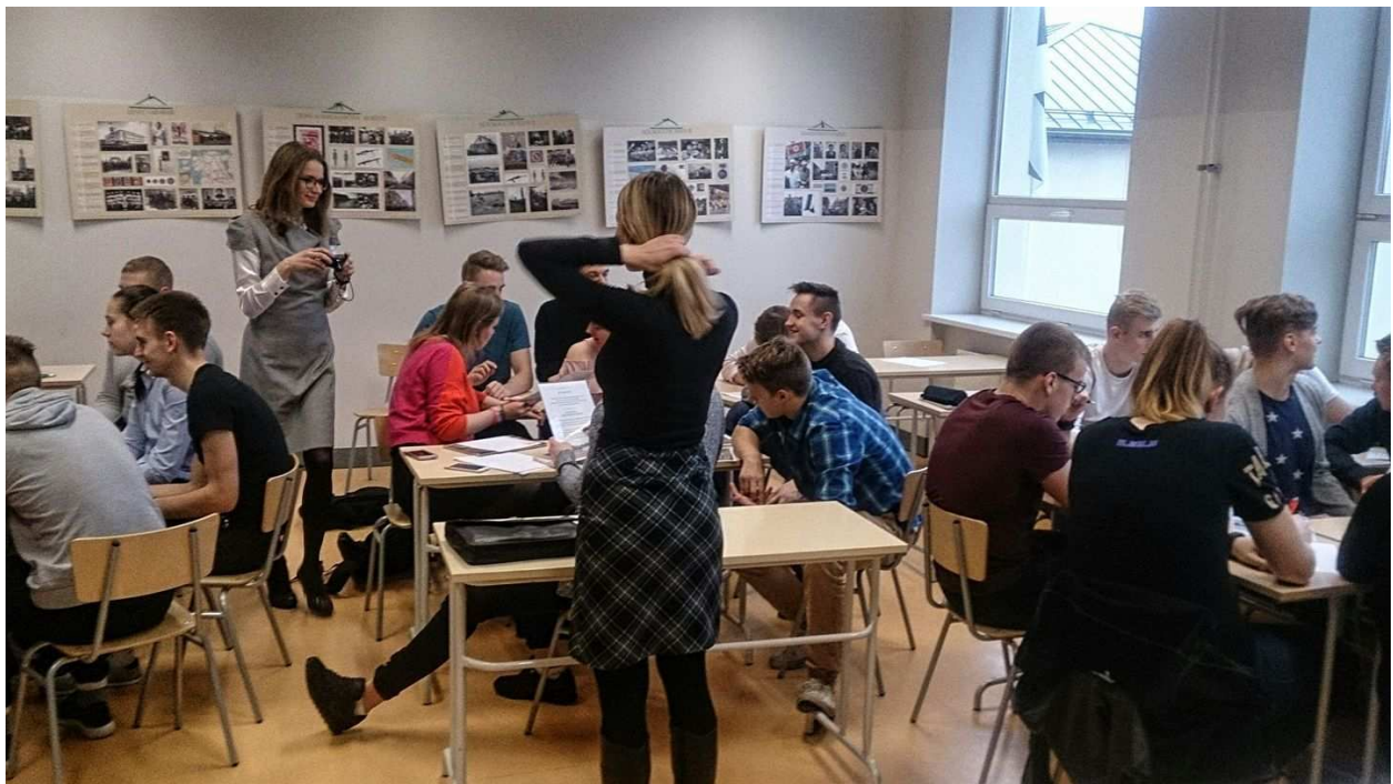
Simulatsioon Audentese Spordigümnaasiumis.

“Hea tava” leppe sõlmimise koolijuhtidega oleme planeerinud vahetult enne 2017. aasta kohalike omavalitsuste valimiste perioodi, kuna sellel hetkel on “Hea tava” mõju kõige suurem. Tööd "Hea tava" loomiseks erakondade ja erakondade noortekogudega alustame juba selle aasta lõpus ning ettevalmistavalt oleme tänaseks kohtunud meie liikmetest erakondade noortekogude esindajatega ning arutanud Hea tava loomist.